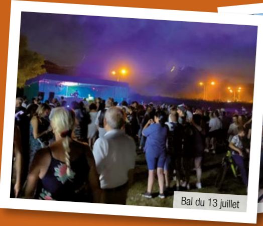
Bal du 13 juillet