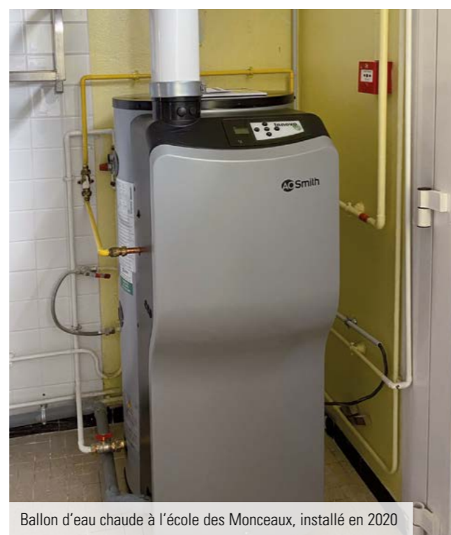
Ballon d'eau chaude à l'école des Monceaux, installé en 2020

Contrairement à l'Etat, une commune ne peut pas voter un budget en déficit, ni emprunter de l'argent auprès d'établissements financiers pour financer ses dépenses de fonctionnement.