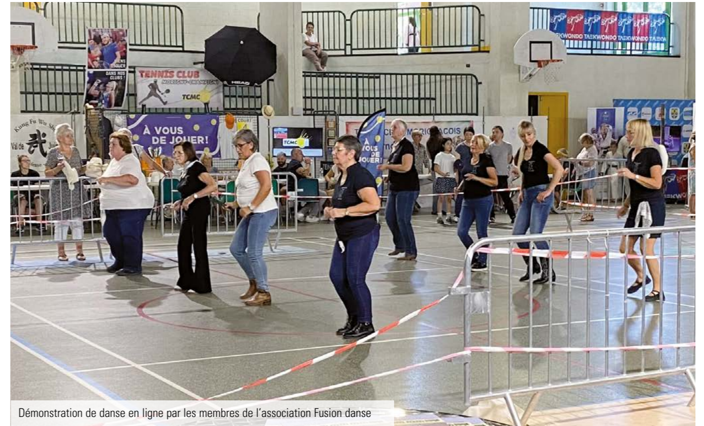
Démonstration de danse en ligne par les membres de l'association Fusion danse

Nous le félicitons pour son implication et les résultats obtenus par le club !