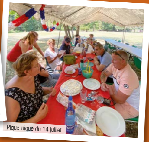
Pique-nique du 14 juillet