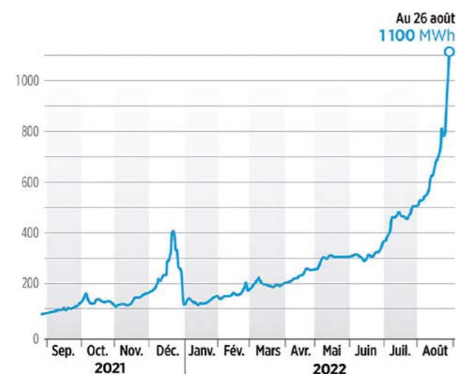
Prix de l'électricité sur les marchés de gros sur la période septembre 2021 et aout 2022 pour une livraison début 2023

Le marché des prix de gros permettent d'acheter des quantités d'électricité ou de gaz pour l'année à venir. Les contrats de fourniture d'électricité et de gaz applicables au titre de l'année 2023 se concluent mi-décembre. Ils se caractérisent par beaucoup de volatilité et une hausse de prix importante.