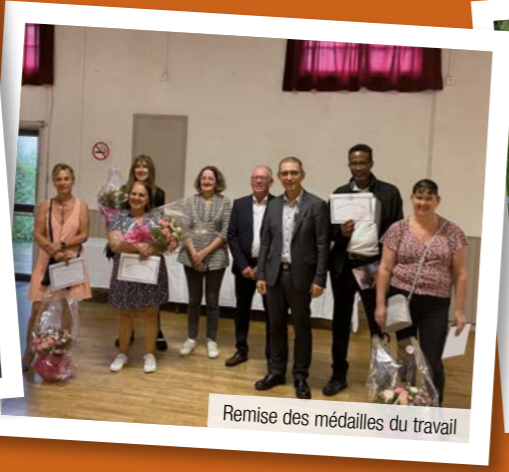
Remise des médailles du travail