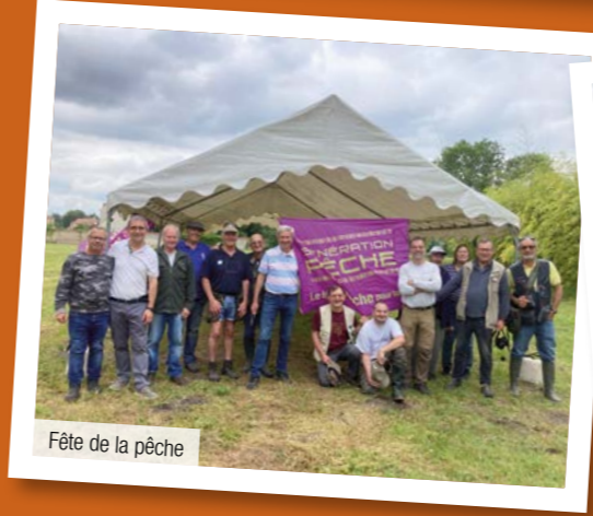
Fête de la pêche