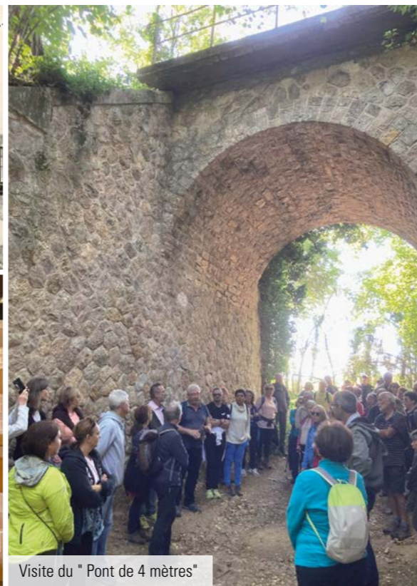
Visite du " Pont de 4 mètres "