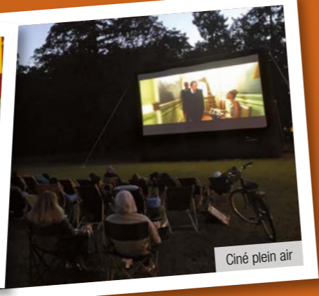
Ciné plein air