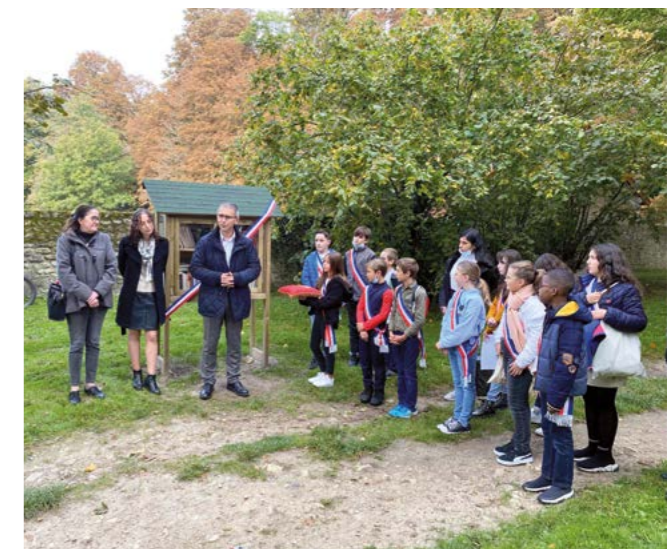
Le CMJ lors de l'inauguration de la boîte aux livres dans le parc Saint-Périer

Nous les félicitons pour leur implication durant leur mandat !