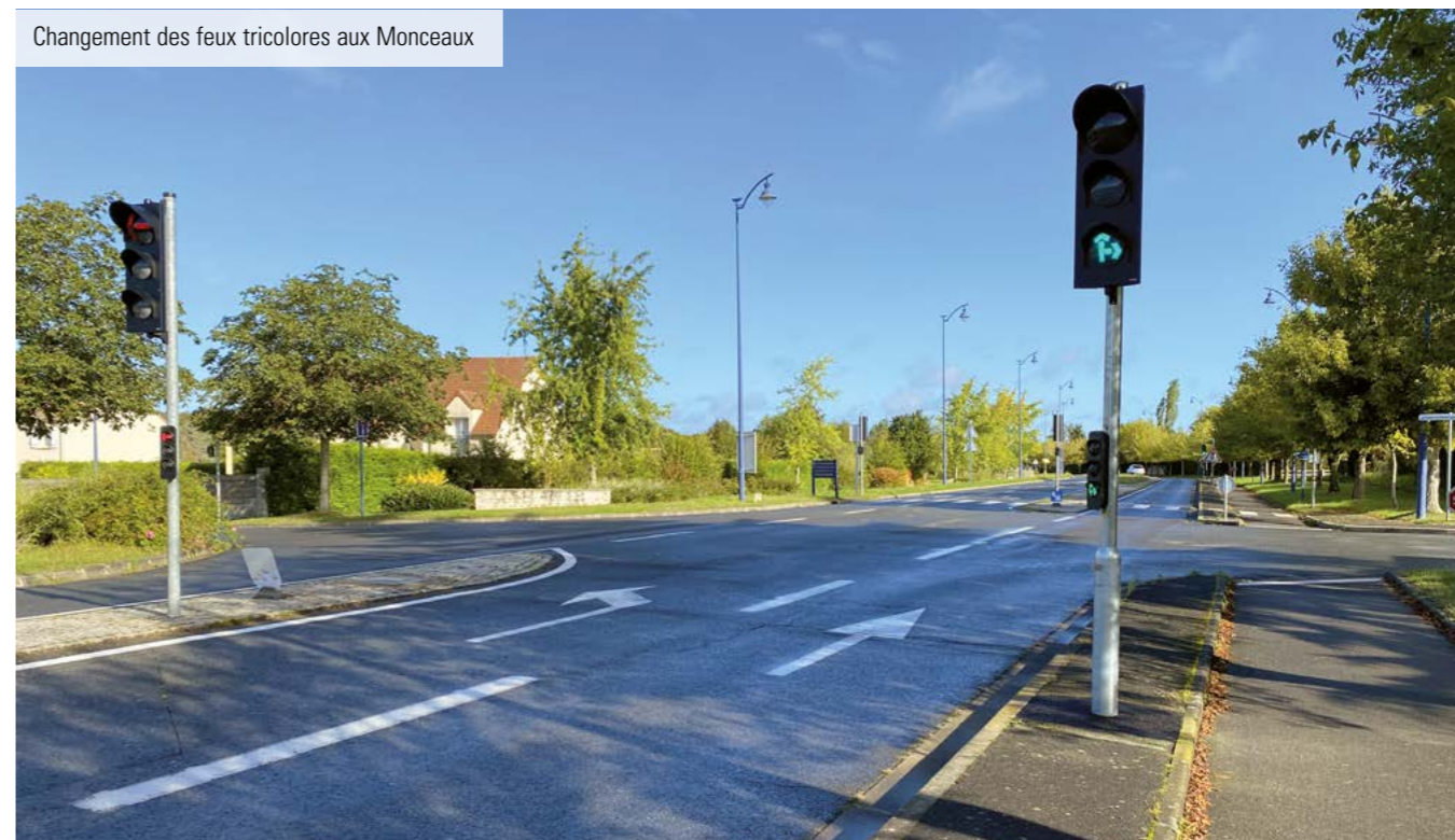
Changement des feux tricolores aux Monceaux

Pour compenser ces augmentations des tarifs énergétiques, il faudrait donc en théorie augmenter les impôts locaux fonciers de 23% à 48%, soit réduire la consommation électrique de - 21% à - 75% et celle de gaz de - 77% à - 86%.