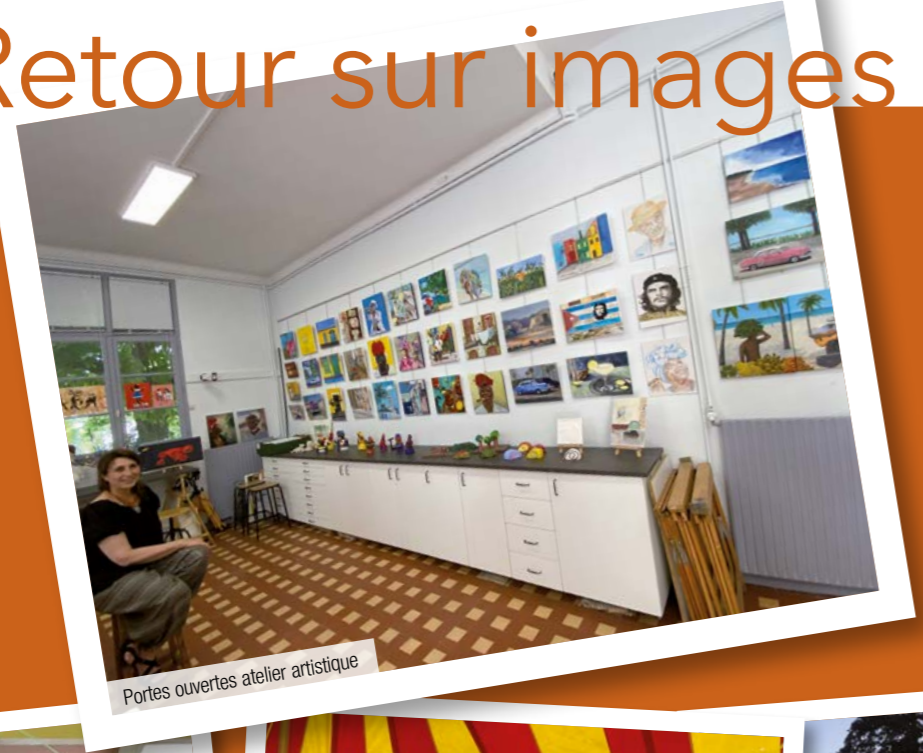
Portes ouvertes atelier artistique