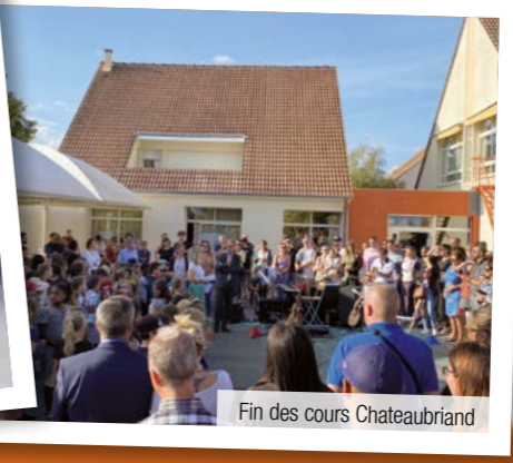
Fin des cours Chateaubriand