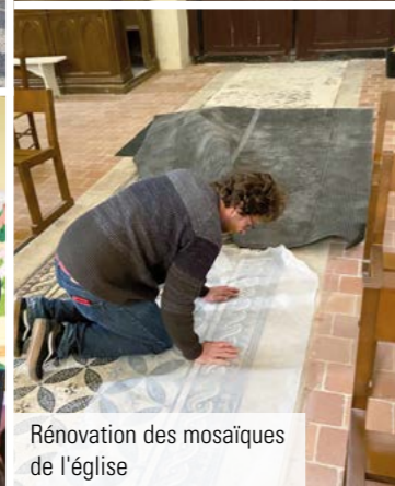
Rénovation des mosaïques de l'église