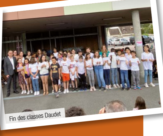
Fin des classes Daudet