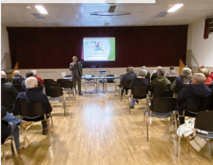
Présentation du plan communal de sobriété pour l'énergie lors d'une réunion publique du 10 novembre 2022

Dans la dernière Lettre du Maire distribuée récemment, il vous a été présenté les 3 principaux axes de ce plan communal de sobriété énergétique. Voici les principales actions mises en œuvre depuis le mois d'octobre.