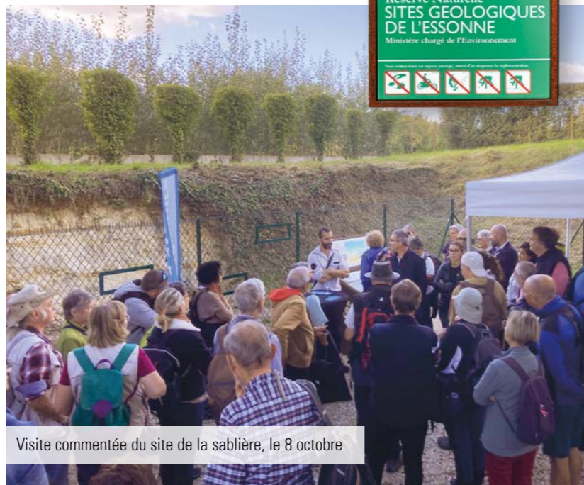
Visite commentée du site de la sablière, le 8 octobre

Coût des travaux : 50 000 €, totalement pris en charge par le Conseil départemental.