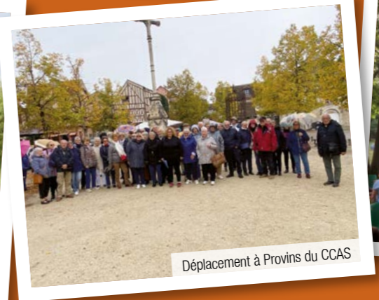
Déplacement à Provins du CCAS