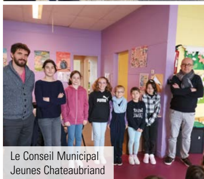
Le Conseil Municipal Jeunes Chateaubriand