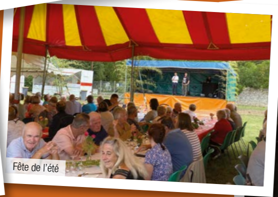
Fête de l'été