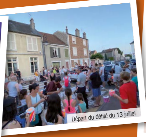
Départ du défilé du 13 juillet