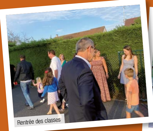
Rentrée des classes