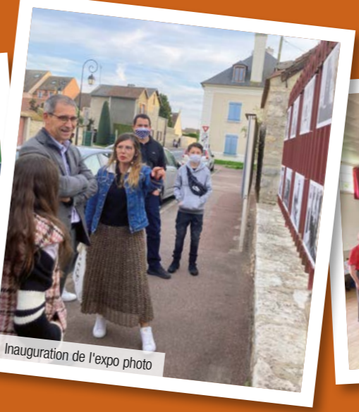
Inauguration de l'expo photo