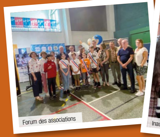
Forum des associations