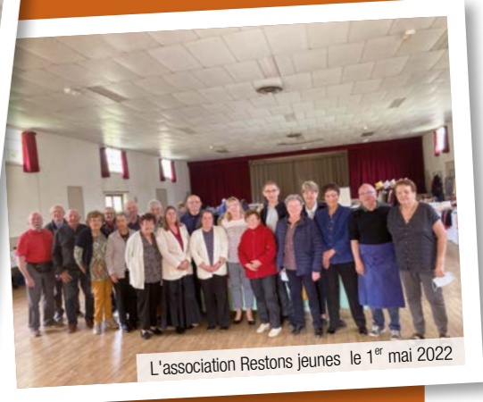
L'association Restons jeunes le 1 er mai 2022