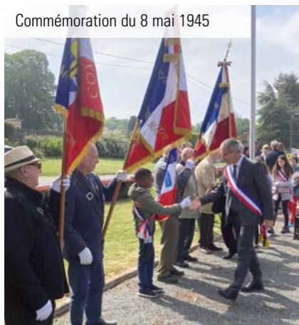
Commemoration du 8 mai 1945