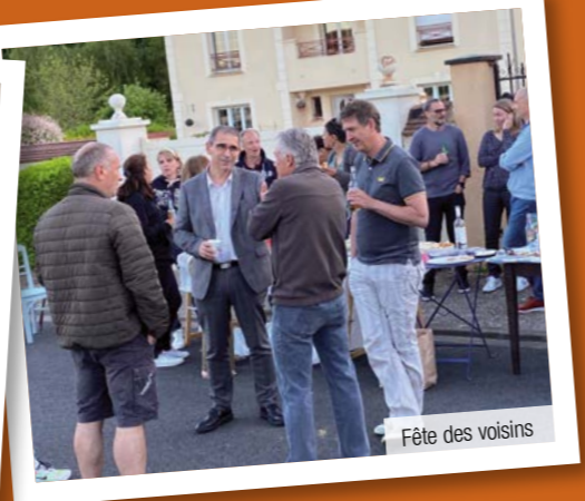
Fête des voisins