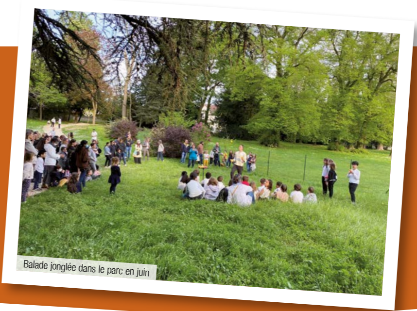
Balade jonglée dans le parc en juin