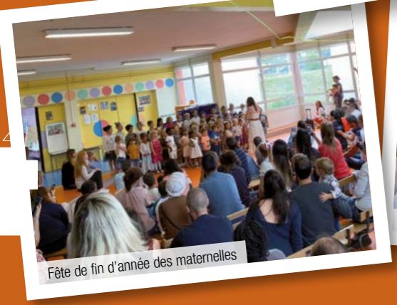
Fête de fin d'année des maternelles