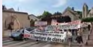
Manifestation le 30 mai à Morigny